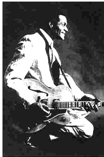
Der Einflussreichste: CHUCK BERRY