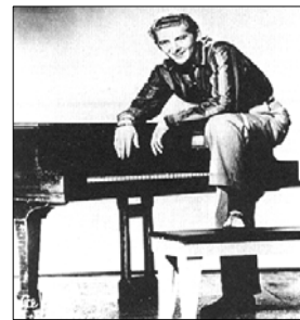
Jerry Lee Lewis