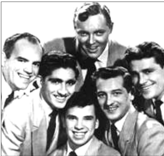
Der Erste: BILL HALEY AND HIS COMETS

In den frühen Fünfzigerjahren wurde die amerikanische Populärmusik von einigen wenigen weissen Interpreten dominiert (Doris Day, Perry Como, Hank Williams u.a.). Ihre Liedchen waren harmlos und zuckersüss . Sie widerspiegeln den Geschmack einer amerikanischen Erwachsenenwelt, die den Erfolg des Wirtschaftswachstums nach dem 2. Weltkrieg in vollen Zügen genoss. Für die Jungen der 50er-Jahre war das zu harmlos. Deshalb schlug der Rock'n'Roll , eine befreiende, hemmungslose, laute und sehr rhythmische Musik wie eine Bombe ein.